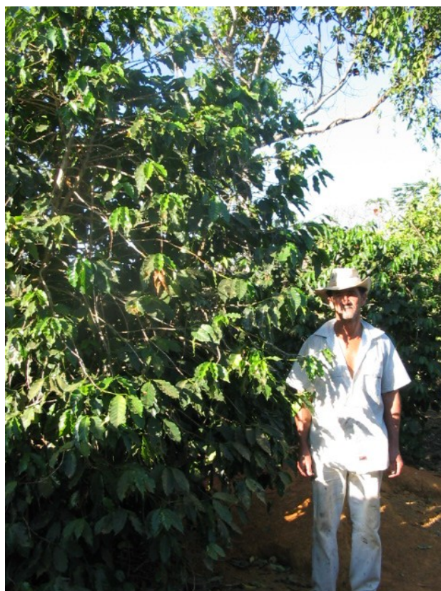
Pé de café antigo