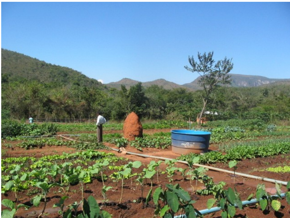
Sistema de irrigação da horta comunitária