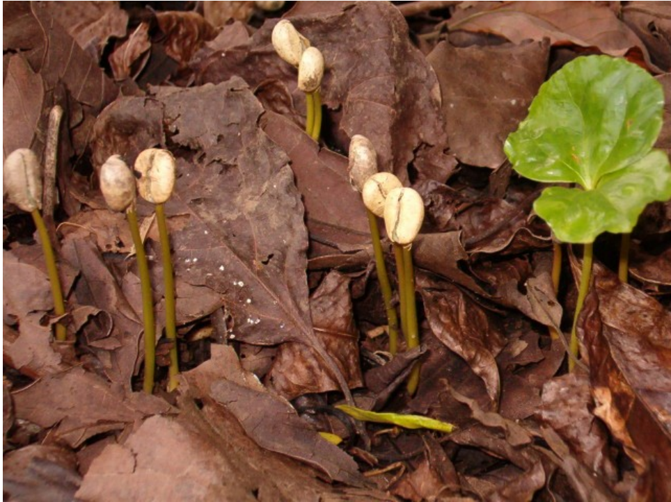
Sementes caídas dos pés antigos brotam com facilidade em meio às folhas no chão