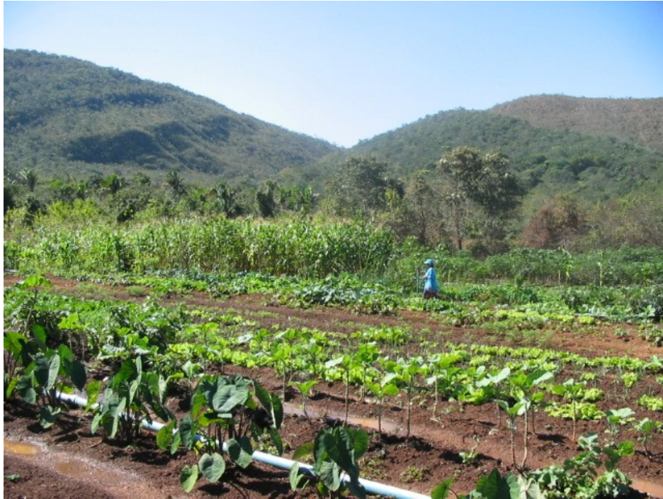
Horta comunitária do Moinho