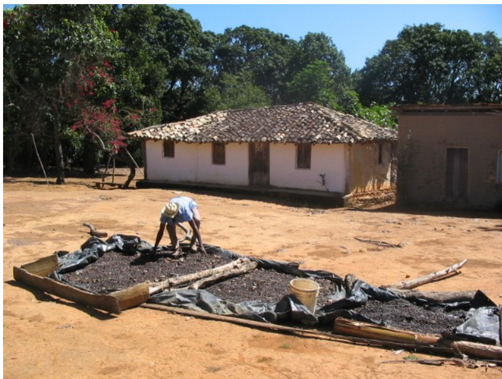
A secagem do café é feita em plásticos pretos