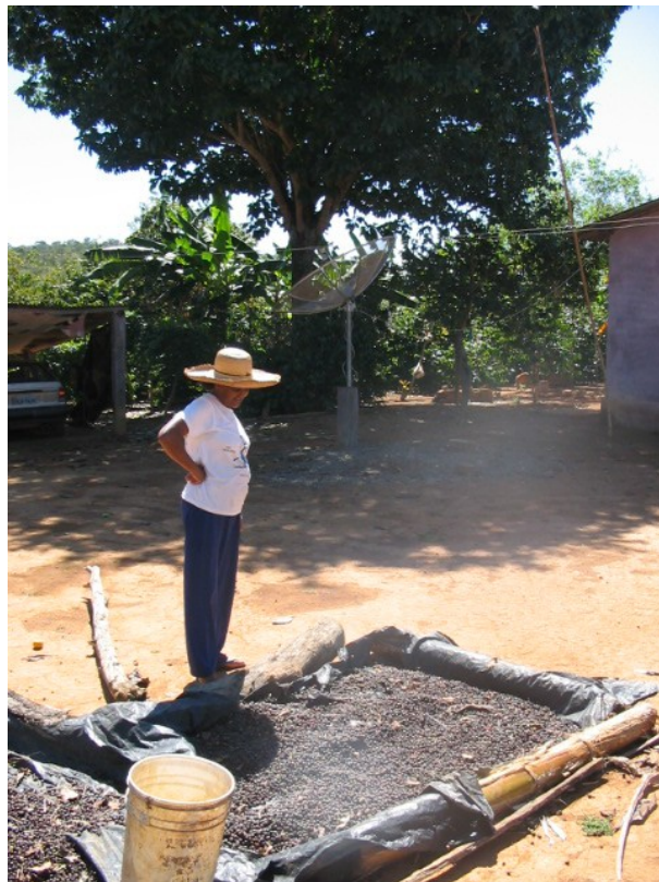
Café secando no terreiro