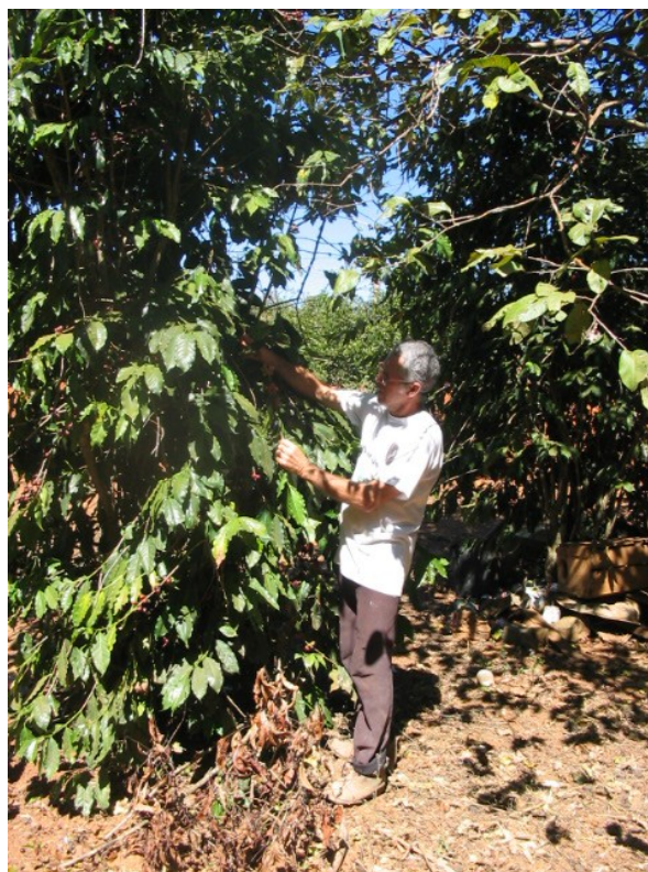
Pés de café antigos, de porte alto