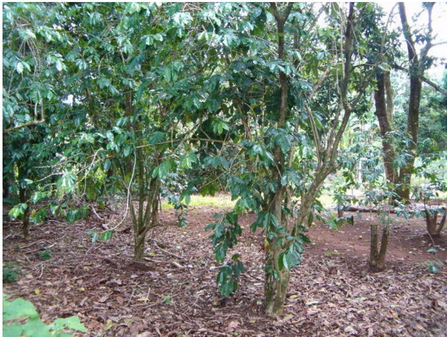
Pés de café da Chapada dos Veadeiros (GO)