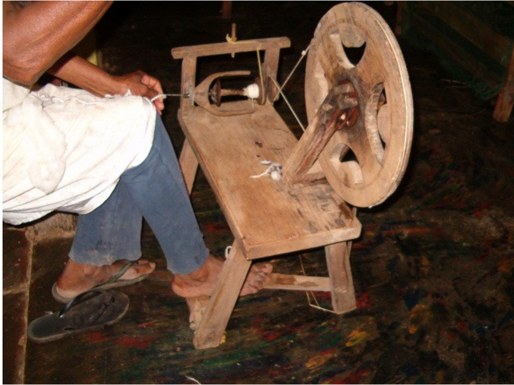
Antigo fiador de algodão