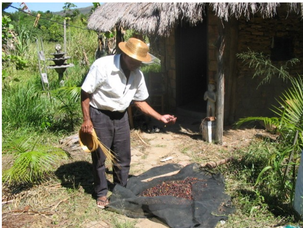
O café e o produto do artesanato feito com plantas do Cerrado